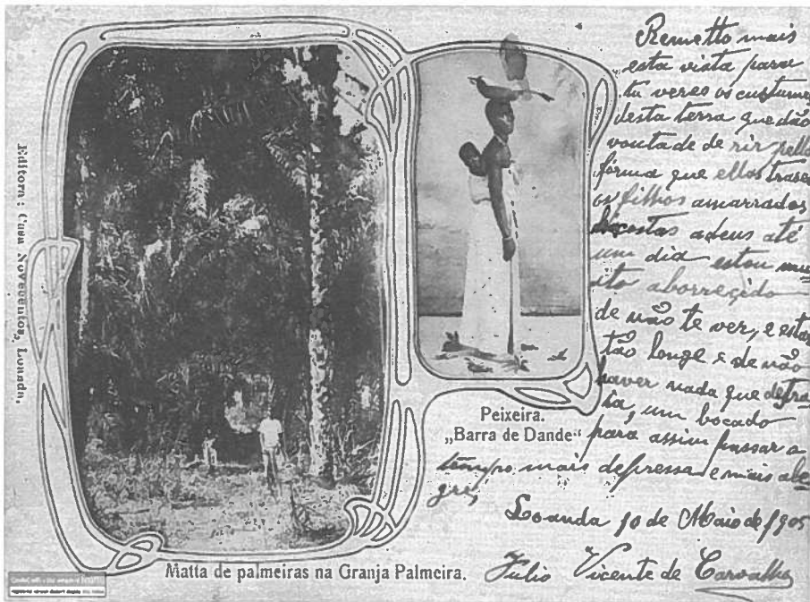
Fotografia 2 – Peixeira