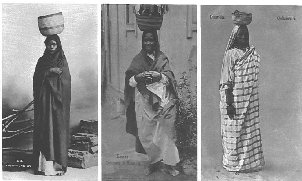
Fotografias 3, 4 e 5 – Quintandeiras