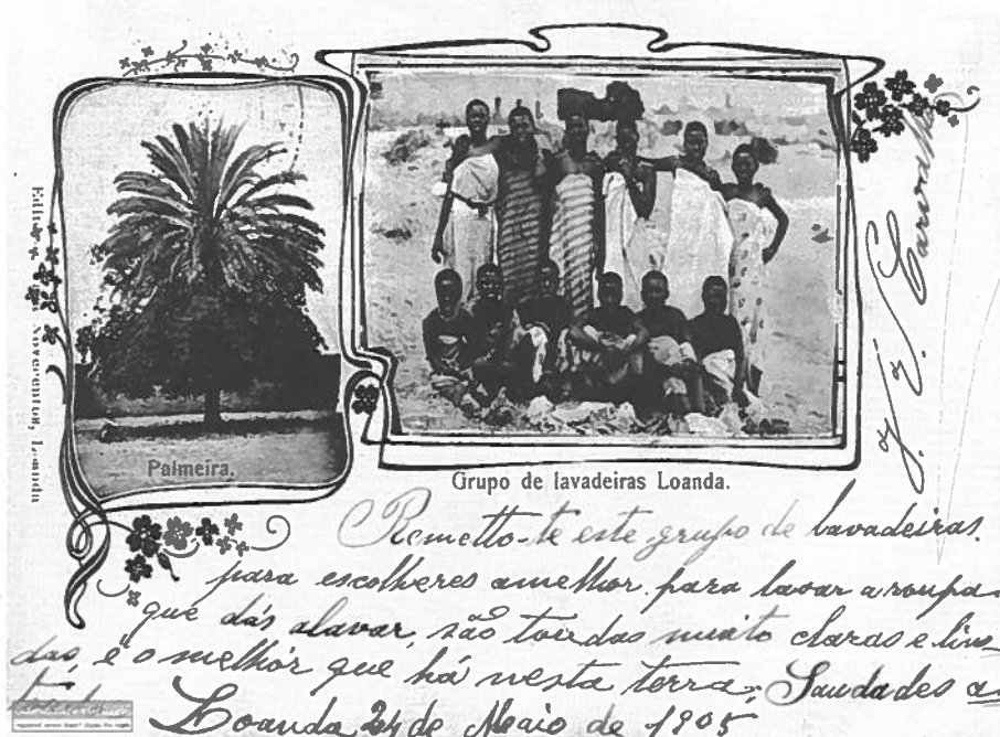
Fotografia 1 – Lavadeiras