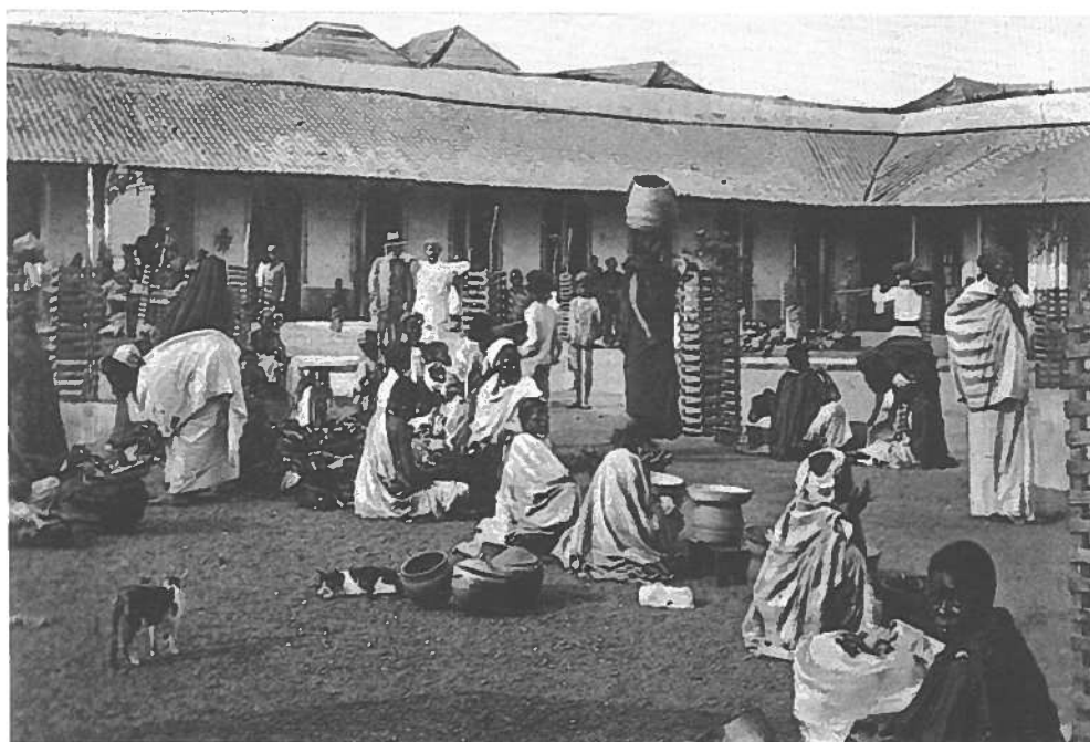
Fotografias 6 – Mercado